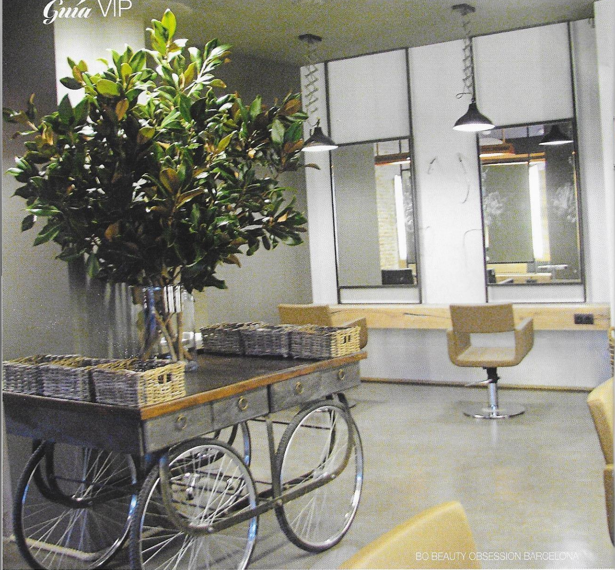
BO BEAUTY OBSESSION BARCELONA